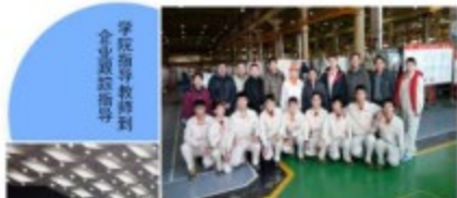
学院领导到企业顶岗指导