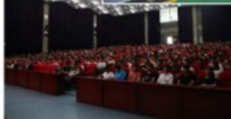
学院顶岗实习动员大会