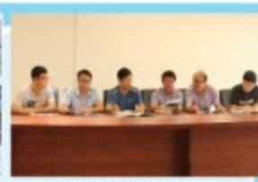
实习管理工作专题研讨会