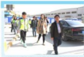
学院领导到施工现场走访督导实习工作

3. 以“五管控”为手段，确保实习工作成效 通过制度管控、机制管控、过程管控、风险管控、信息化管控，实现全员、全过程、全方位管理，整体提升实习管理水平，以过程管控为例：（1）学生实习要做到“7有”安置：有企业岗位、有指导教师、有学习任务、有食宿安排、有交通安排、有实习补贴、有实习保险。（2）二级学院院长、书记是部门实习全面工作和过程管理总负责人；二级学院班子成员对实习学生分片包干，各自分管一片“责任田”；所有教师都要承担实习指导或管理任务；所有学生都有专门教师指导和管理；所有学生干部都要对组内学生进行日常管理。（3）实行指导检查和周报制度，实现过程常态化监控。做到“天天有跟踪，周周有指导，月月有检查，层层有报告”。