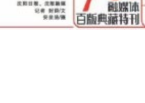
实现职教振兴的“沈职模式”