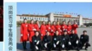
顶岗实习学生服务两会